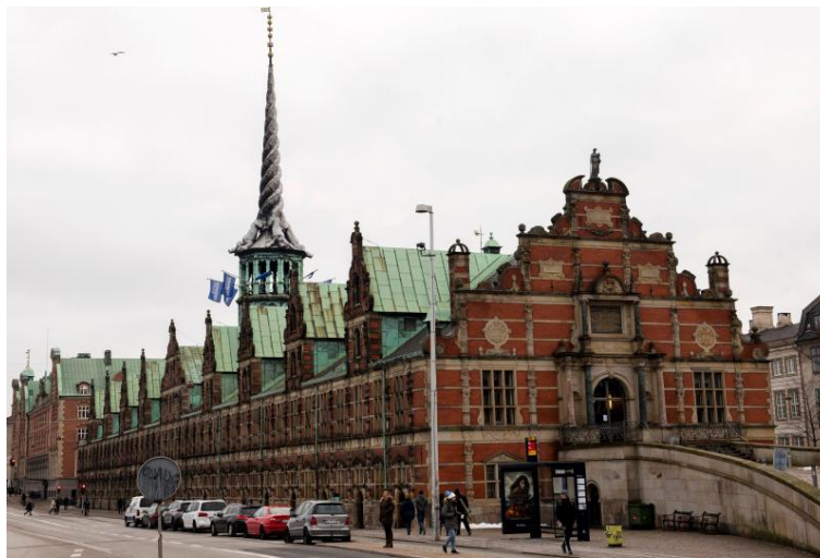
Wahrzeichen von Kopenhagen: die Alte Börse vor der Zerstörung

Kürzlich legte König Frederik X. den Grundstein für den Wiederaufbau, der keine „zeitgenössische Interpretation“ der Alten Börse sein wird, sondern eine originalgetreue Rekonstruktion ( https://www.nordschleswiger.dk/de/daenemark-kultur-gesellschaft/wiederaufbau-boerse-150-jahre-alten-baeumen ). Genauso hatten es die Dänen nach dem Großbrand im Renaissance-Schloss Frederiksborg im Jahre 1859 gemacht. In dieser Frage, sagte der Däne Claus Ruhe Madsen, Wirtschaftsminister von Schleswig-Holstein, könne es „keine zwei Meinungen geben“. Die Alte Börse sei „zu ikonisch, um sie nicht genauso wieder herzurichten“, wie sie war.