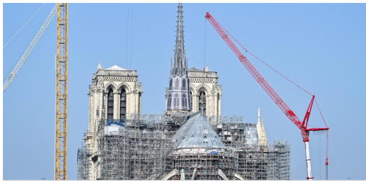
Notre-Dame in Paris mit dem rekonstruierten filigranen Dachreiter