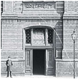
Westseite der Bauakademie (Ausschnitt)

Die Schinkelschen Fassaden bestimmten jedoch die Proportionen des Inneren und das Raster des Gebäudes. Das Innere hatte keine tragenden Wände und war daher frei gestaltbar.