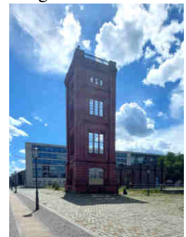
Musterfassade.