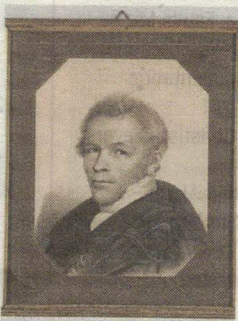
Karl Friedrich Schinkel, um 1826.