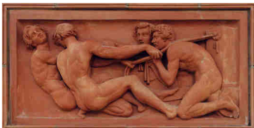
Heranbringen des Baumaterials, Musterfassade (Nord-Ost-Achse der Bauakademie - Bildhauerwerkstatt Hoferick -)