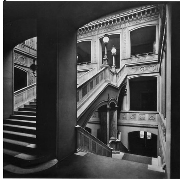
Blick ins Treppenhaus der Bauakademie im Jahr 1911: Zu erkennen sind Elemente des Stützpfelersystems mit flachen Deckengewölben.

Schinkel stand für beide Institutionen: Seit 1820 arbeitete er als Professor an der Bauakademie, 1830 stieg er zum Direktor der Oberbaudeputation auf. Da war er bereits ein berühmter Mann, hatte Bedeutendes wie die Friedrichswerdersche Kirche errichtet. Bei Hofe war er wohl gelitten.