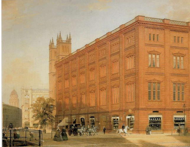
Die Berliner Bauakademie 1868 auf einem Gemälde von Eduard Gärtner: im Erdgeschoss Läden, im zweiten Obergeschoss Schinkels Dienstwohnung mit Gardinen.