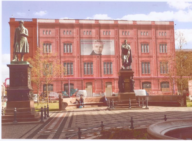
Bauakademieatraspe mit den Denkmälern von Peter Beuth (links) und Karl Friedrich Schinkel (rechts); Foto: Gisela Krehne statt des in der Berliner Zeitung veröffentlichten Fotos

Die Institution Bauakademie arbeitete von 1836 bis 1884 in dem Gebäude. Die Studentenzahl stieg stetig und spiegelte den wachsenden Bedarf an kompetenten Bauleuten. Im Winter 1859/60 zählte man 547 Studenten, 1871/72 waren es 783. Ein Umbau sollte mehr Platz schaffen, doch dann ging die Bauakademie 1879 in der Technischen Hochschule Berlin auf und zog 1884 in Neubauten in Charlottenburg (heute Straße des 17. Juni) um. Damit war auch das Ende des Gebäudes als Bauakademie besiegelt.